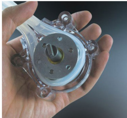
2. 将软管绕滚轮一周，再合并于出口处。