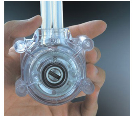
3. 适当拉紧软管，合上另一半泵头外壳。